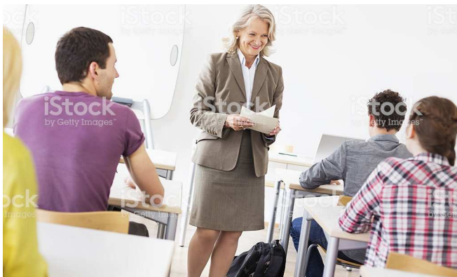
taking from から取って